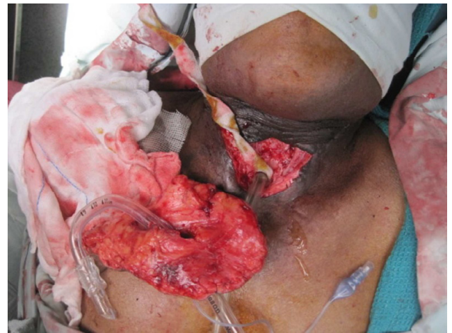
Figura 2. Retalho bipediculado recebendo suprimento sanguíneo por intersecção a partir da terminação distal.

da traqueia com tecido saudável não irradiado. Decidiu-se pelo uso de retalho deltopeitoral modificado para conectar a traqueia por meio de abordagem única. A técnica e medidas apropriadas foram conduzidas e o retalho deltopeitoral padrão foi marcado. O retalho era curto e não houve necessidade de excesso. O retalho fasciocutâneo foi suspenso. Após a suspensão do retalho, esse foi posicionado no defeito, e o local que correspondia ao estoma foi marcado. Uma incisão longitudinal, aproximadamente duas vezes maior em diâmetro do estoma traqueostomia foi marcada. Isso converteu o tecido em ambos os lados da incisão para um tipo de retalho mini-bipediculado com razão de largura variando 1,5:1 e como tal recebeu suprimento sanguíneo por intersecção a partir da terminação distal (Figura 2).