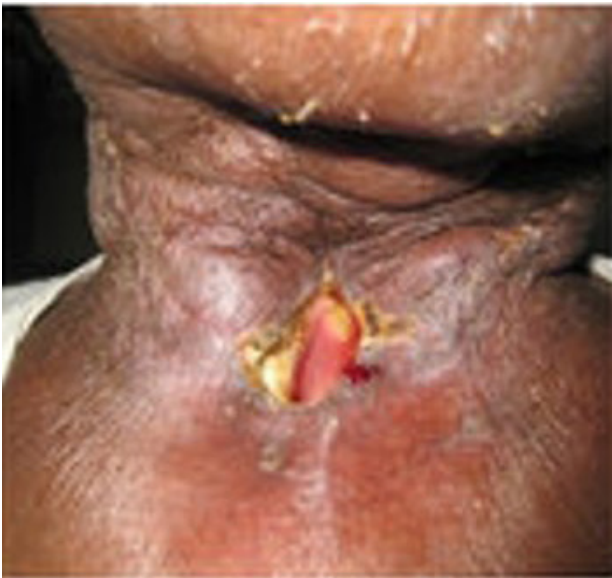
Figura 1. Local do estoma com retração e deiscência da lesão.

Paciente realizou laringectomia total devido a câncer de laringe. Após o procedimento, foi submetido à radioterapia pós-operatória por dois meses. O tratamento radioterápico levou ao rompimento da linha da sutura do local da traqueostomia e desenvolvimento de fistula faringocutânea. Quando o paciente foi encaminhado para nosso serviço, estava sendo alimentado por sonda nasogástrica. Como resultado na pele lesionada, observou-se isquemia da pele ao redor do local do estoma com retração da traqueia e deiscência da ferida (Figura 1).