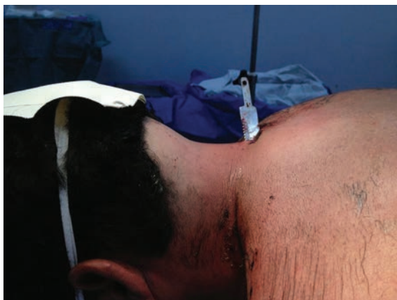
Fig. 1 Ferimento por arma branca retida em coluna cervical.

Apresentava-se hemodinamicamente estável, com vias aéreas pérvias, respirando espontaneamente, sem dor abdominal, em decúbito ventral, imobilizado e com uma faca retida em coluna cervical. Ao exame neurológico, verificou-se escala de coma de Glasgow de 15, força de grau V em membro inferior direito e plegia em membro inferior esquerdo. Apresentava nível motor em C6 à esquerda, com força de grau III e sem déficit à direita. Sensibilidade termoálgica abolida à direita e preservada à esquerda. Sensibilidade vibratória e cinético-postural abolida à esquerda e preservada à direita. Ausência de nível sensitivo. O paciente