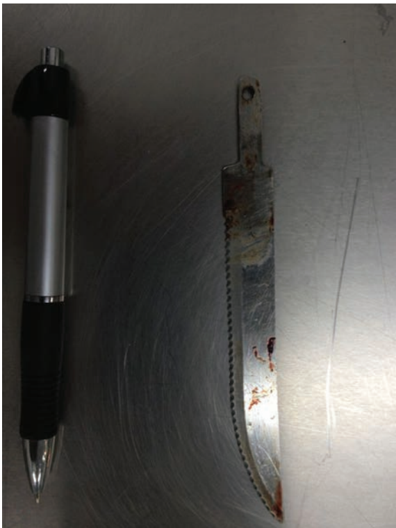
Fig. 4 Corpo estranho retirado após laminectomia.