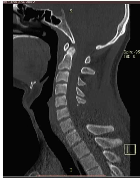
Fig. 5 Tomografia da coluna cervical pós-operatória.