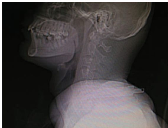
Fig. 2 Radiografia da admissão em perfil, evidenciando arma branca na coluna cervical posterior, no nível de C6-C7.

O paciente permaneceu internado por 8 dias e recebeu alta com o quadro neurológico semelhante ao da admissão. Não apresentou fistula liquórica nem infecção da ferida operatória. Não apresentou sinais clínicos de lesão da artéria vertebral. Após 3 meses de alta, deambulava com muletas, com força de grau V em ambos os membros superiores e com força de grau II no membro inferior esquerdo. A tomografia de controle mostrou ausência de corpos estranhos ou fragmentos ósseos no canal vertebral, com lordose cervical preservada (►Figs. 5 e 6). O exame de raios X dinâmico não demonstrou luxações. Foram