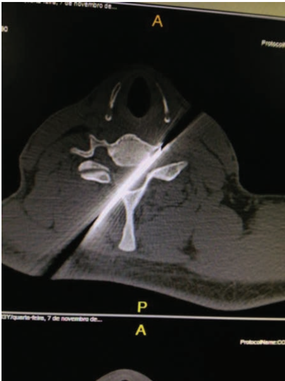
Fig. 3 Tomografia da coluna cervical pré-operatória em corte axial, mostrando trajeto da arma através da vértebra, com penetração do canal vertebral até o forame da artéria vertebral esquerda.