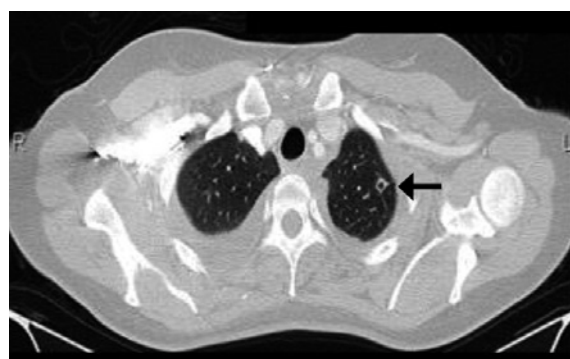
Figura 2. Nódulo cavitado em lobo superior esquerdo, evidenciando embolia séptica (seta preta).

Devido ao quadro de tromboembolismo pulmonar concomitante, foi optado por iniciar anticoagulação com enoxaparina 1mg/kg, por via subcutânea, a cada 12 horas, seguida da troca por rivaroxabana. A paciente permaneceu internada por 30 dias, recebendo durante todo esse período antibioticoterapia (ceftriaxona e clindamicina) e anticoagulação. Ao longo do internamento, apresentou melhora efetiva dos padrões hemodinâmicos, saturação de oxigênio e estado geral. Recebeu alta com rivaroxabana 20mg ao dia, com plano de uso por 6 meses.