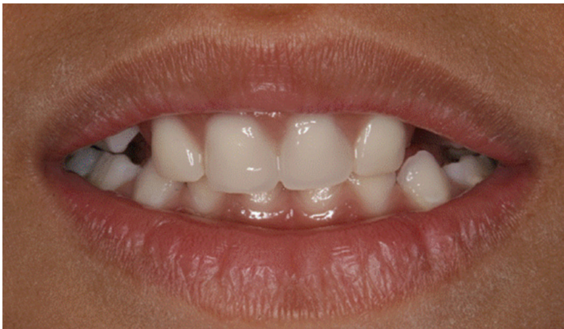
Figura 6: Aparelho estético funcional (sorriso baixo)