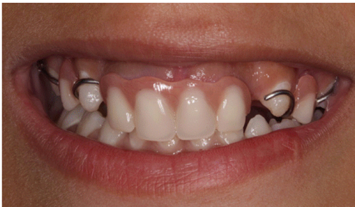
Figura 5: Aparelho estético funcional (sorriso alto)

Para o acompanhamento do caso foram realizadas consultas mensais, para avaliar o uso e a adaptação do aparelho mantenedor de espaço, atividade de cárie, e restaurações realizadas (Figuras 5,6).