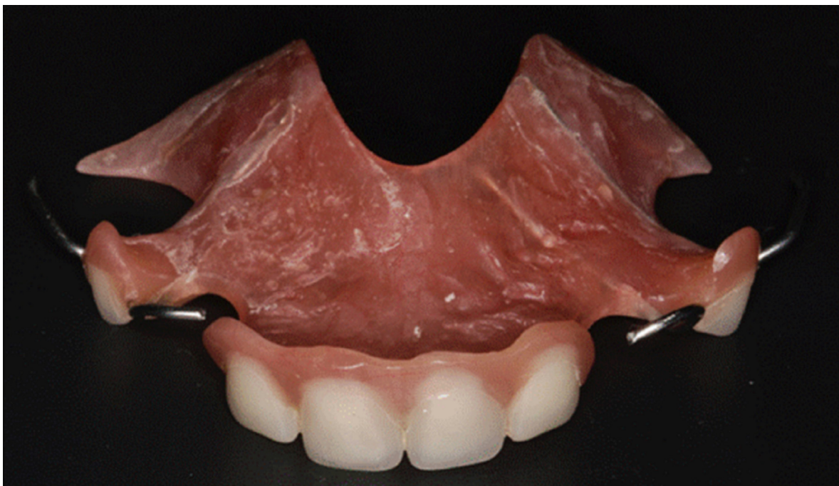
Figura 4: Aparelho estético funcional