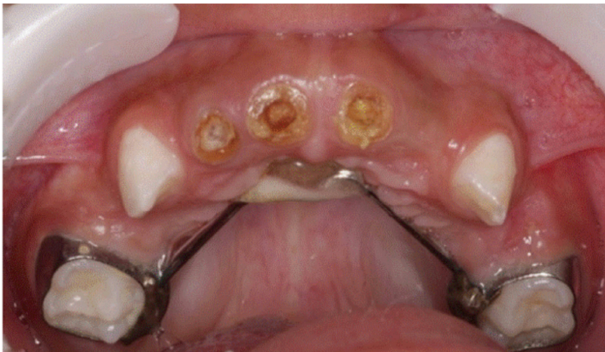
Figura 3: Botão de Nance instalado