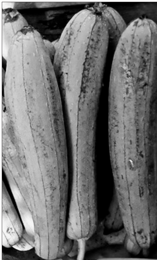
Figura 2. Imagen del fruto de la Luffa cylíndrica .

La Luffa cylíndrica , cuyos nombres comunes son: tusa, estropajo, esponjilla, pertenece a la Familia de las Cucurbitaceae. Crece en África Asia tropical y América, siendo Japón el principal productor (3) . Las fibras de sus frutos maduros son empleados en medicina tradicional China desde el siglo X d.C. Pertenece al grupo de plantas industriales, es una enredadera anual, con hojas grandes lobuladas y flores masculinas amarillas, los frutos son cilíndricos alargados y gruesos (Fig. 2).