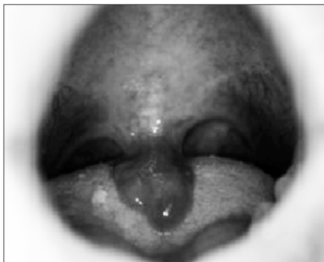
Figura 1. Intenso edema de úvula ocasionado por instilación intranasal de extracto de Tuffa cylindrica .

Al examen físico, es un paciente afrodescendiente, afebril, hidratado con prurito cutáneo leve, no presencia de erupción, pupilas isocóricas reactivas a la luz. Tensión arterial: 149/87 mmHg; temperatura: 37 °C. Boca: hipertrofia y edema de úvula acentuado (Fig. 1), faringe congestiva, amígdalas hipertróficas. Fosas nasales: eritema de mucosa e hipertrofia de cornete inferior y medio. Cuello móvil sin daños aparentes. Cardiopulmonar: ruidos cardiacos normales, sin soplos y frecuencia cardiaca: 95 pulsaciones/min. Respiratorio: ruidos respiratorios normales en ambos campos pulmonares, sin agregados, con frecuencia respiratoria: 18 por minuto. Abdomen: blando, no doloroso a palpación, sin megalias aparentes. Neurológico: consciente, orientado, marcha normal. Lenguaje por señas. Por dificultad para hablar.