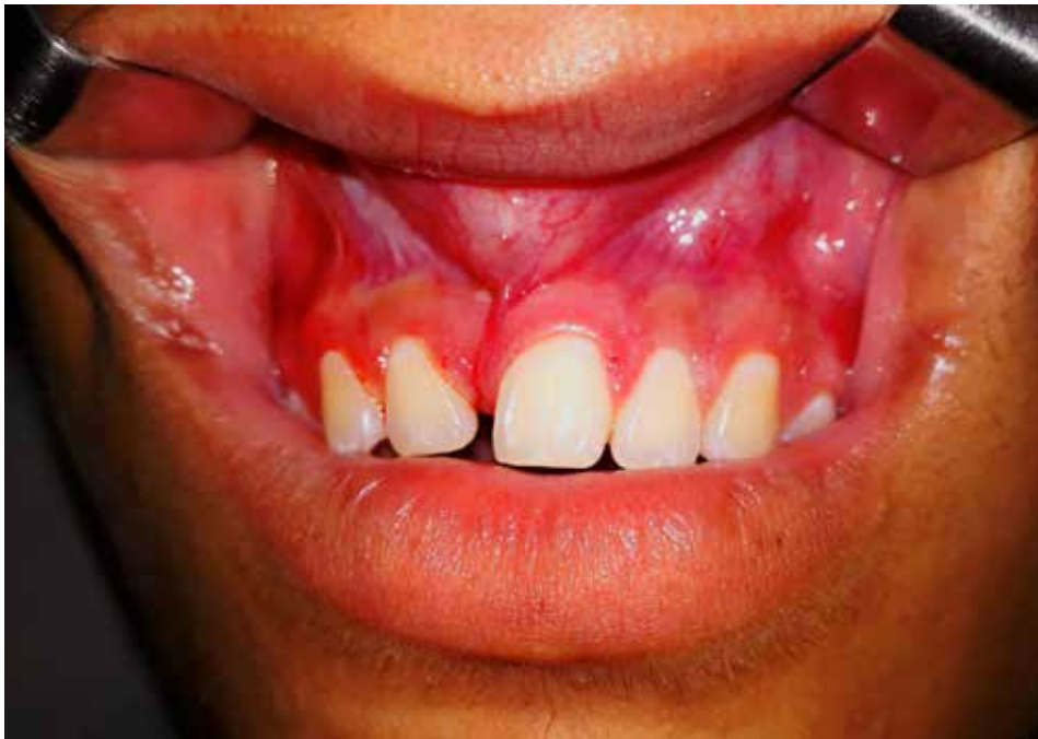
Figura 2. Paciente com comprometimento estético e forças de segregação pela ausência do elemento 11.

Foi realizada incisão intrassulcular com acesso de Newmann modificado com lâmina de bisturi número 15, deslocamento mucoperiosteal 5 e exposição do tecido ósseo para posterior osteotomia (Figura 3). O dente 11 apresentava-se semi-incluído, sendo necessária leve osteotomia com broca cirúrgica laminada de 27mm, para facilitação do perfil para remoção do elemento. Não foi realizada a odonto-secção, apenas a luxação da coroa com alavanca Seldin reta número 2 (adulto), para exérese do dente 5 (Figura 4).