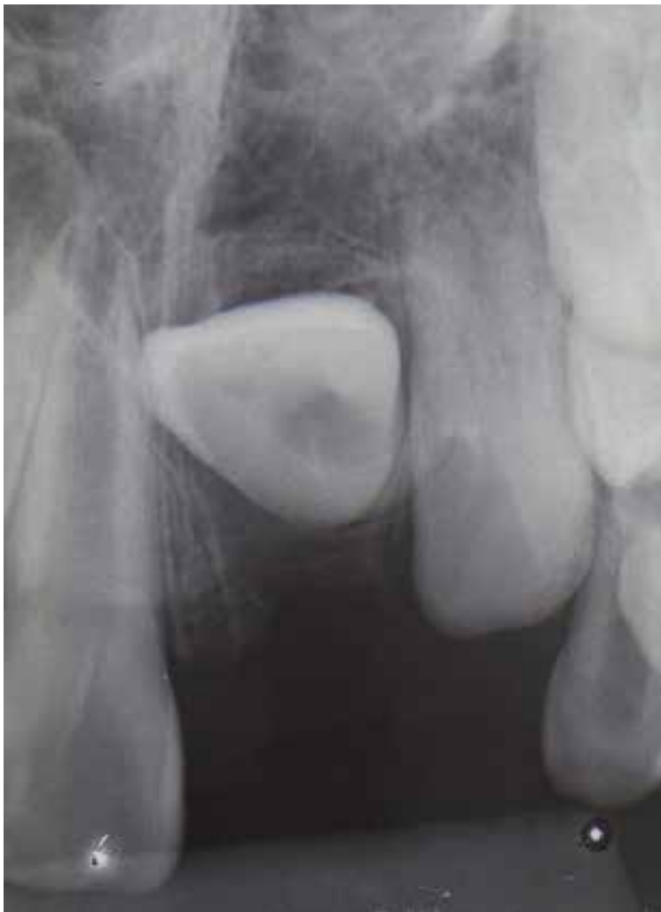
Figura 7. Dente 11 em radiografia periapical.

observe a limitação de posicionamento obtida com a radiografia periapical do caso clínico apresentado (Figura 7).