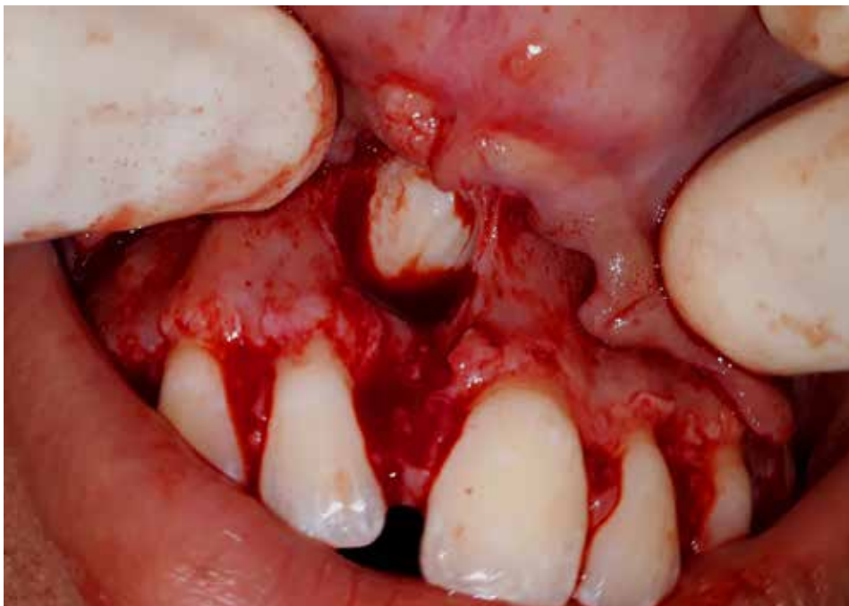
Figura 3. Localização do dente 11 após deslocamento mucoperiosteal do retalho.

Foi realizada incisão intrassulcular com acesso de Newmann modificado com lâmina de bisturi número 15, deslocamento mucoperiosteal 5 e exposição do tecido ósseo para posterior osteotomia (Figura 3). O dente 11 apresentava-se semi-incluído, sendo necessária leve osteotomia com broca cirúrgica laminada de 27mm, para facilitação do perfil para remoção do elemento. Não foi realizada a odonto-secção, apenas a luxação da coroa com alavanca Seldin reta número 2 (adulto), para exérese do dente 5 (Figura 4).