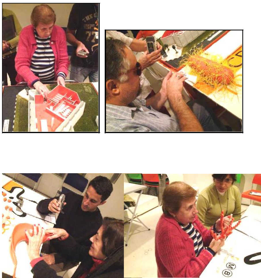
Figura 4 – Sujeitos colaboradores da pesquisa manipulando os elementos do MicroToque durante as entrevistas.

Duas instituições foram convidadas a participar como parceiros dessa análise: a Fundação Dorina Nowill para Cegos e a Laramara – Associação Brasileira de Assistência ao Deficiente Visual. Foram realizadas entrevistas semi-estruturadas, em um número total de sete (sendo que somente três foram aqui consideradas), que ocorreram em momentos separados para os indivíduos das duas instituições (Figura 4).