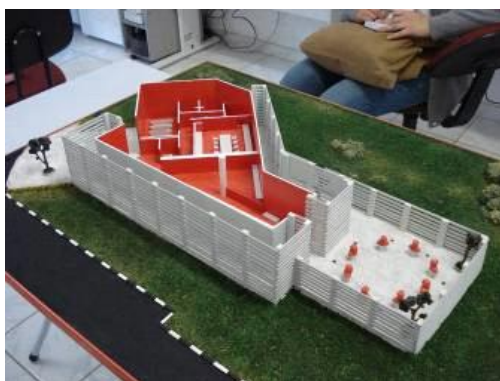
Figura 1 – Maquetes externa e interna do Museu de Microbiologia.

A maquete externa possibilita a exploração da parte artística do prédio que abriga o Museu. A maquete interna apresenta suas subdivisões como a Exposição de Longa Duração, o Laboratório, a Praça dos Cientistas e o Auditório, evidenciadas por texturas em relevo. As maquetes foram produzidas com materiais de alta resistência ao toque, coloridos com duas cores contrastantes, de forma a facilitar a visualização por pessoas com baixa visão (Figura 1).