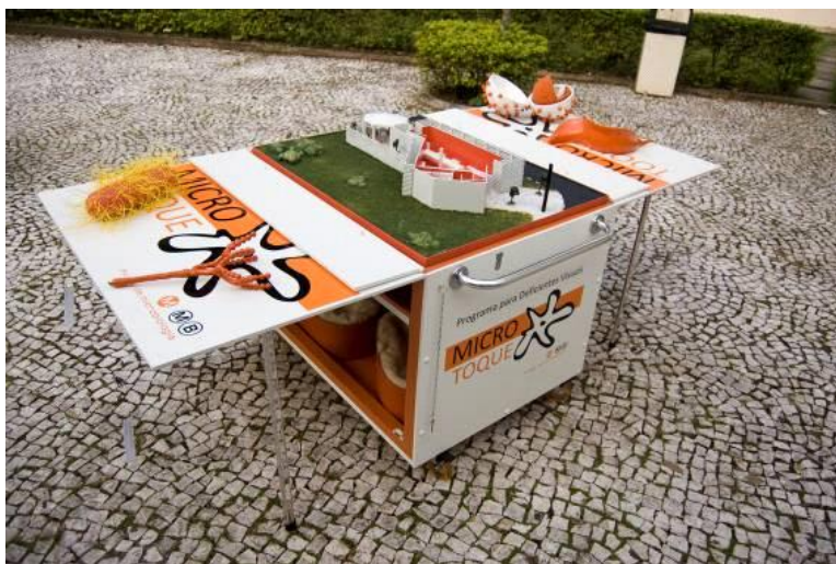
Figura 3 – Carrinho “MicroToque”

Os materiais tridimensionais para toque são acompanhados por um áudio-guia gravado em formato MP3. Esse áudio contém informações sobre o uso da maquete, fornecendo as descrições dos ambientes internos e externos do Museu, o que possibilita ao deficiente visual uma melhor localização nesse espaço físico. Apresenta também um texto introdutório sobre o que são os microrganismos, suas funções, onde podem ser encontrados, entre outros elementos, além de quatro arquivos enfatizando as características específicas de cada um dos microrganismos representados.