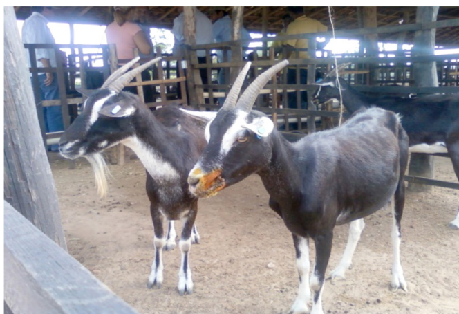
Figura 1. Lesão na região bucal causada pelo vírus Orf em cabra da raça Canindé e posterior tratamento com antisséptico local

rebanhos distintos e com lesões em locais anatômicos diferentes. No foco do condomínio de Barreira, as lesões se caracterizavam por crostas labiais em todo o rebanho, enquanto no foco de Pedra Alta as lesões estavam restritas aos tetos das glândulas mamárias das cabras e em quase todo o rebanho (Figura 1). As amostras coletadas da zona dos lábios e tetos foram processadas e resultaram positivas para a amplificação de genes ORFV 011 (BL2) e ORFV 059 (F1L), com bandas de peso molecular de 1.200 pb e de 1.062 pb, respectivamente (Figura 2).