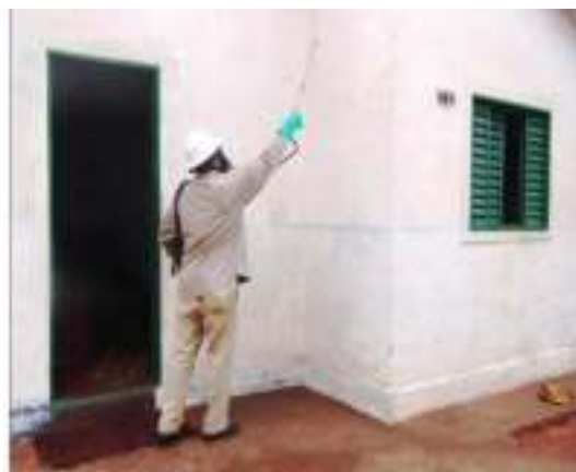
Figura 8. Aplicação de inseticida no peridomicílio.

Cabe destacar que medidas de manejo ambiental devem ser realizadas anteriormente ao controle químico. Além disso, é necessário que o controle do reservatório canino já tenha sido realizado ou esteja sendo implementado na área de ocorrência dos casos.