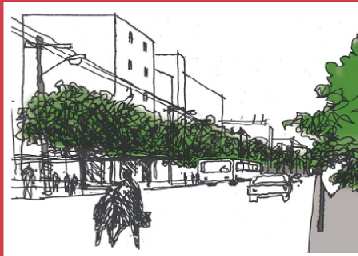
Arborização Adamantina retirado do Portal da PM.