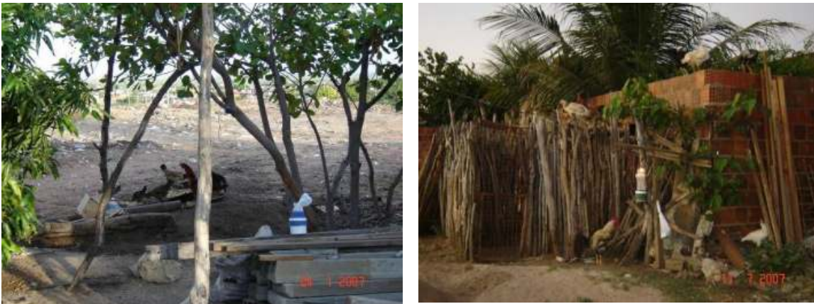
Figura 2. Peridomicílios de residências propícias ao desenvolvimento de flebotomíneos.

Os flebotomíneos são insetos muito sensíveis às mudanças ambientais, dessa forma, sua criação em laboratório torna-se extremamente laboriosa e difícil. Tal fato, porém, não significa que, assim como outros dípteros, eles não possam se adaptar aos ambientes modificados, uma vez que algumas espécies estão adaptadas para frequentar áreas próximas ao ambiente domiciliar ou peridomiciliar humano.