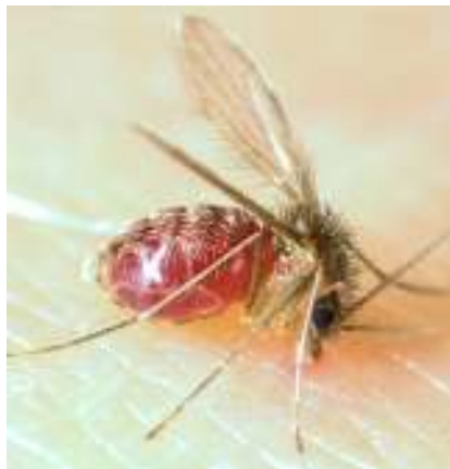
Figura 1. Lutzomyia longipalpis

Apresentam um par de asas e um par de pequenas estruturas, chamados de halteres ou balancins, responsáveis pela estabilidade do vôle e zumbido característico dos dípteros. Os flebotomíneos apresentam um vôle curto. Na realidade eles saltitam na superfície de pouso e mantém as asas eretas, ou seja, levantadas para cima. No Brasil, são conhecidos por diferentes nomes de acordo com sua ocorrência geográfica, como tatuquira, mosquito palha, asa dura, asa branca, cangalhinha, birigui, anjinho, entre outros.