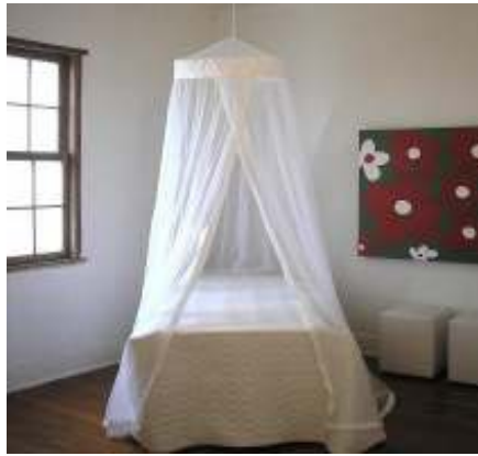
Figura 6. Mosquiteiro