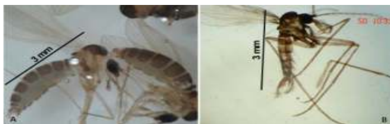
Figura 4. Adultos de L. longipalpis observados em estereomicroscópio com aumento 80x: A - macho e B - fêmea.