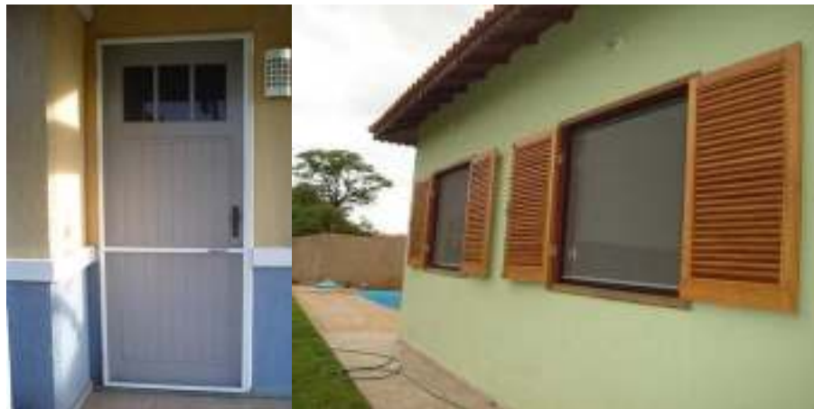
Figura 7. Telas em porta e janela.