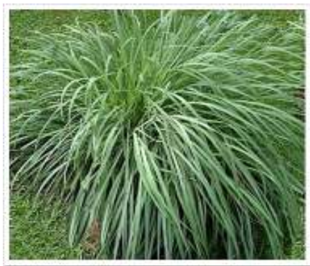
Figura 5. Citronela

Para melhor proteção contra picadas, o repelente deve ser usado no crepúsculo e noite.