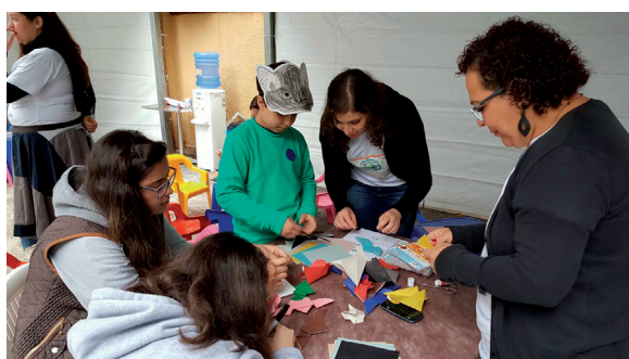
Figura 6. Oficina lúdica: origami e pintura de máscaras

A experiência da integração, tanto com o CCZ-SP quanto com a WAP, foi enriquecedora, pois possibilitou o desenvolvimento de diferentes atividades e abordagens de assuntos pertinentes à prevenção da raiva, reforçando a importância de se trabalhar de forma conjunta, unindo forças para o bem comum, neste caso, o maior esclarecimento da população sobre a raiva, que é uma importante zoonose que ainda hoje assola a população mundial.