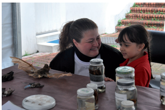
Figura 4. Apresentação de morcegos taxidermizados e fixados

Ao final da visita, foram oferecidas atividades lúdicas. Entre elas uma contação de história, quando os participantes puderam apreciar uma história relacionada ao bem-estar animal, também com a colaboração da ONG WAP (Figura 5). Os visitantes puderam ainda participar da confecção de origami e de pintura de máscaras, que remetiam aos principais reservatórios da raiva no Brasil (Figura 6).