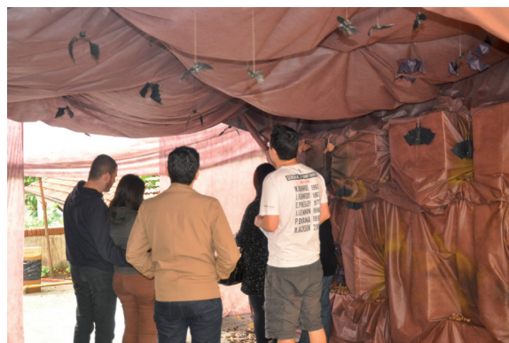
Figura 3. Caverna com morcegos

guiada na entrada principal do Instituto Pasteur, com um breve histórico sobre a instituição e sobre a raiva. Em seguida, o grupo era levado à apresentação de um teatro de fantoches, tendo como enfoque principal os reservatórios do vírus da raiva e as formas de prevenção da doença. O grupo foi então guiado à parte interna do Instituto, passando por uma caverna cenográfica com morcegos feitos de origami e de EVA e recebendo informações sobre diferentes espécies destes animais (Figura 3). Posteriormente, foi possível obter mais informações sobre os morcegos e observar espécimes reais destes, conservados de diferentes formas, taxidermizados e fixados, gentilmente disponibilizados pelo Centro de Controle de Zoonoses de São Paulo (CCZ-SP). As informações incluíram uma explanação sobre a importância desses animais na natureza e os cuidados no contato com eles para evitar a transmissão da raiva (Figura 4). Outra atividade foi a apresentação de dois vídeos, um sobre aspectos gerais da raiva e outro sobre as cinco chaves para a prevenção de mordidas de cães, cedido pela Organização Não Governamental (ONG) de Proteção Animal Mundial ( World Animal Protection - WAP), que colaborou com o evento. O material educativo produzido pela WAP está disponibilizado no site https://www.worldanimalprotection.org.br .