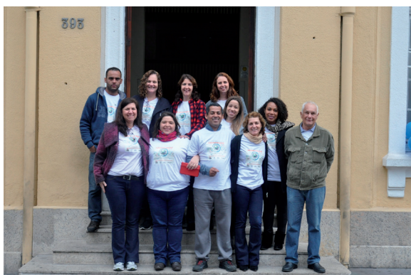
Figura 2. Voluntários do evento “Instituto Pasteur de portas abertas”

O evento foi organizado em visitas guiadas, de no máximo 20 participantes, que tiveram a oportunidade de percorrer a instituição e participar de diferentes atividades. Para guias e instrutores dessas atividades houve a participação voluntária dos funcionários do Instituto Pasteur, de diferentes áreas, que colaboraram nas diversas atividades desenvolvidas, desde a organização do evento até a finalização deste (Figuras 1 e 2). Para melhor organização no Instituto, os visitantes foram divididos em grupos, formados a partir da inscrição, e acompanhados por monitores durante todo o percurso.