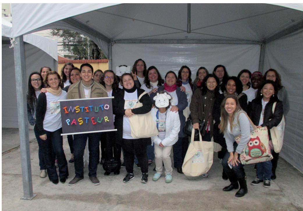
Figura 1. Voluntários do evento “Instituto Pasteur de portas abertas”

Instituto Pasteur de São Paulo. Coordenadoria de Controle de Doenças. Secretaria de Estado de Saúde. São Paulo, Brasil