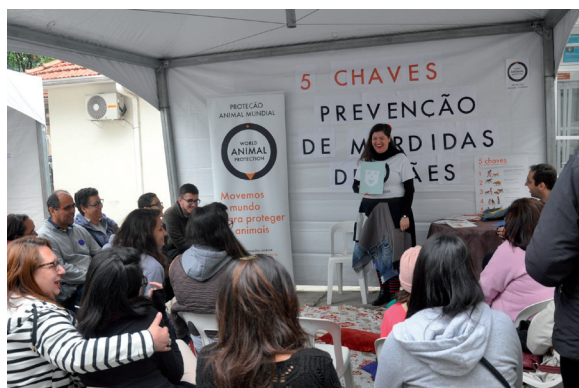
Figura 5. Contação de história

Ao final da visita, foram oferecidas atividades lúdicas. Entre elas uma contação de história, quando os participantes puderam apreciar uma história relacionada ao bem-estar animal, também com a colaboração da ONG WAP (Figura 5). Os visitantes puderam ainda participar da confecção de origami e de pintura de máscaras, que remetiam aos principais reservatórios da raiva no Brasil (Figura 6).