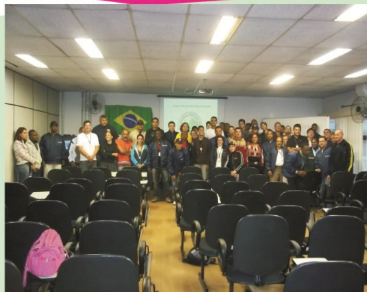
Turma de Agentes de Zoonoses