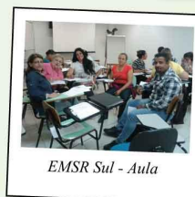
EMSR Sul - Aula