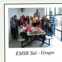
EMSR Sul - Grupo