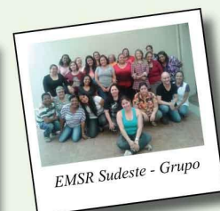
EMSR Sudeste - Grupo