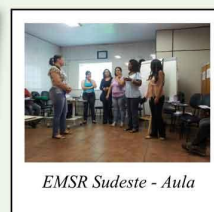
EMSR Sudeste - Aula