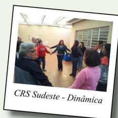
CRS Sudeste - Dinâmica

A reflexão sobre a própria prática dos alunos fez com que revissem a sua postura profissional com vistas a modificá-las se necessário.