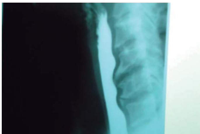
Figura 1. Esofagograma de bário evidenciando obstruções em nível de C5-C7.

Não houve intercorrências no pós-operatório. Vinte e quatro horas após o procedimento cirúrgico a paciente relatou melhora acentuada da deglutição e das dores cervicais. Em radiografia de controle três meses após a cirurgia observou-se a artrodese estável. Não foi realizado novo esofagograma porque a paciente se apresentou completamente assintomática.