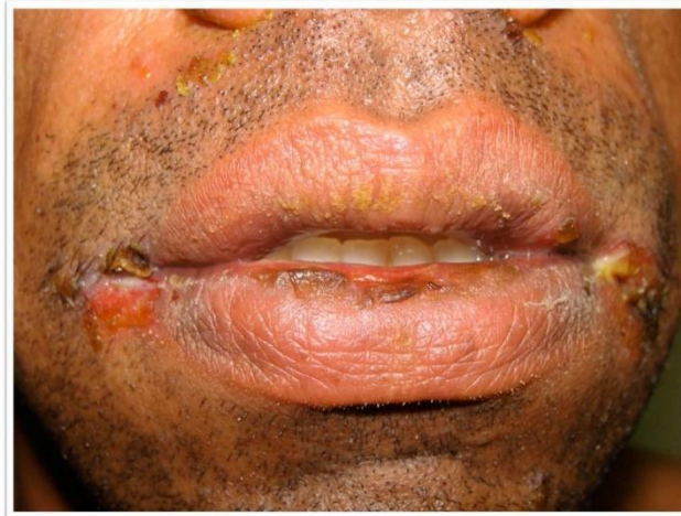
Figura 1. Pénfigo vulgar. Leves erosiones costras en labios y comisuras.