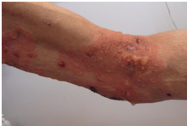
Figura 4. Caso 2. Placa eritematosa sobre la que asienta ampollas tensas, áreas denudadas y costrosas en flexura de codo.

Al examen físico se observan placas eritematosas de bordes irregulares límites netos sobre las que asientan ampollas tensas de contenido seroso, con áreas denudadas y costrosas (Figura 4). Estas lesiones diseminadas se intercalan con ampollas sobre piel sana, configurando aspecto de rosetas en ciertas regiones (Figura 5). Áreas erosionadas en boca y pene.