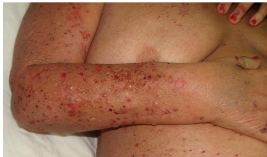
Figura 1. Caso 1. Vesículas y ampollas tensas, sobre piel preferentemente sana, en brazo y tronco. Áreas erosionadas y costrosas.

Al examen físico se aprecian vesículas y ampollas tensas de contenido turbio, de bordes irregulares, límites netos, que asientan preferentemente sobre piel sana, afectando rostro, tronco superior y extremidades (Figura 1), incluso palmas y plantas. Áreas denudadas, más extensas en miembros inferiores, costras hemáticas. Mucosa sin afectación.