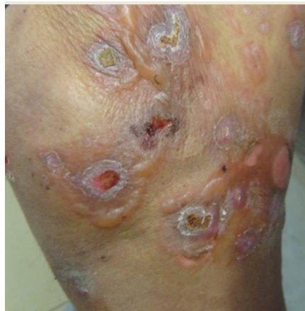
Figura 5. Caso 2. Ampollas sobre piel sana, algunas configurando aspecto de rosetas en muslo.

Al ingreso presenta 8.700 glóbulos blancos/mm 3 (Neutrófilos 80%, linfocitos 10%, monocitos 10%); hemoglobina 11 g/dL, hematocrito 31%; glicemia 101 mg/dL; urea 16 mg/dL; creatinina: 0,47 mg/dL; PCR: 1,8 mg/L (inferior a 0,3). Hepatograma y marcadores tumorales normales.