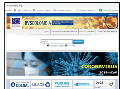
Figura 3 - Portal BVS Colômbia – link para a vitrine