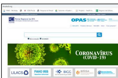
Figura 1 - Portal Regional da BVS- link para a vitrine

Recomenda-se criar destaque nos portais da BVS com link para a vitrine de conhecimento do Coronavírus e criar destaque com estratégia de busca que facilite a recuperação de documentos sobre essa temática. Exemplos de destaques criados: