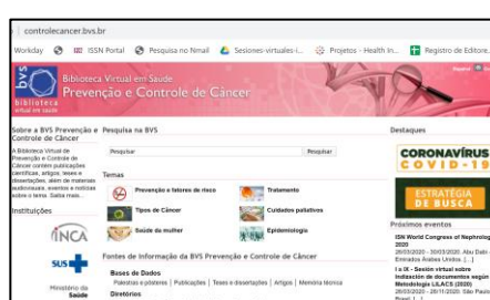
Figura 2 - Portal BVS Prevenção e Controle do Câncer – estratégia de busca