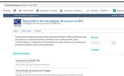
Figura 6 - Página do Repositório

Repositório de estratégias de busca na BVS: Coleção de estratégias de busca elaboradas pela BIREME e Rede de Referencistas para apoiar a construção de filtros temáticos para Instâncias BVS, datas comemorativas ou campanhas de promoção da saúde, estudos com análises da produção científica, entre outras aplicações. Para contribuir contatar bir.online@paho.org com o assunto “Estratégias para RefNet”.