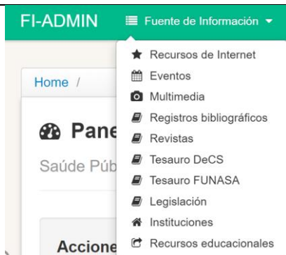
Figura 5- Menu de tipos de fontes de informação no sistema FI-Admin

O usuário e senha é igual para o BIREME Accounts e o FI-Admin.