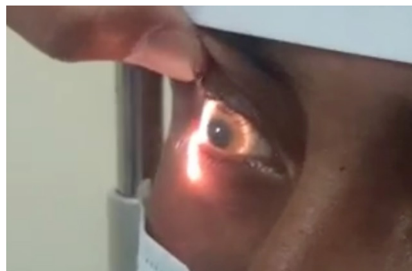
Anillo de Kayser Fleischer, secundario a la acumulación de hierro a nivel de la córnea, característico de la Enfermedad de Wilson.

En los exámenes complementarios se evidenció pancitopenia, tiempos de coagulación prolongados, hiperbilirrubinemia directa, elevación de transaminasas por encima de tres veces el valor normal, con aumento de la fosfatasa alcalina. La ecografía abdominal demostró disminución del tamaño de hígado con líquido libre en espacio de Morrison, es-