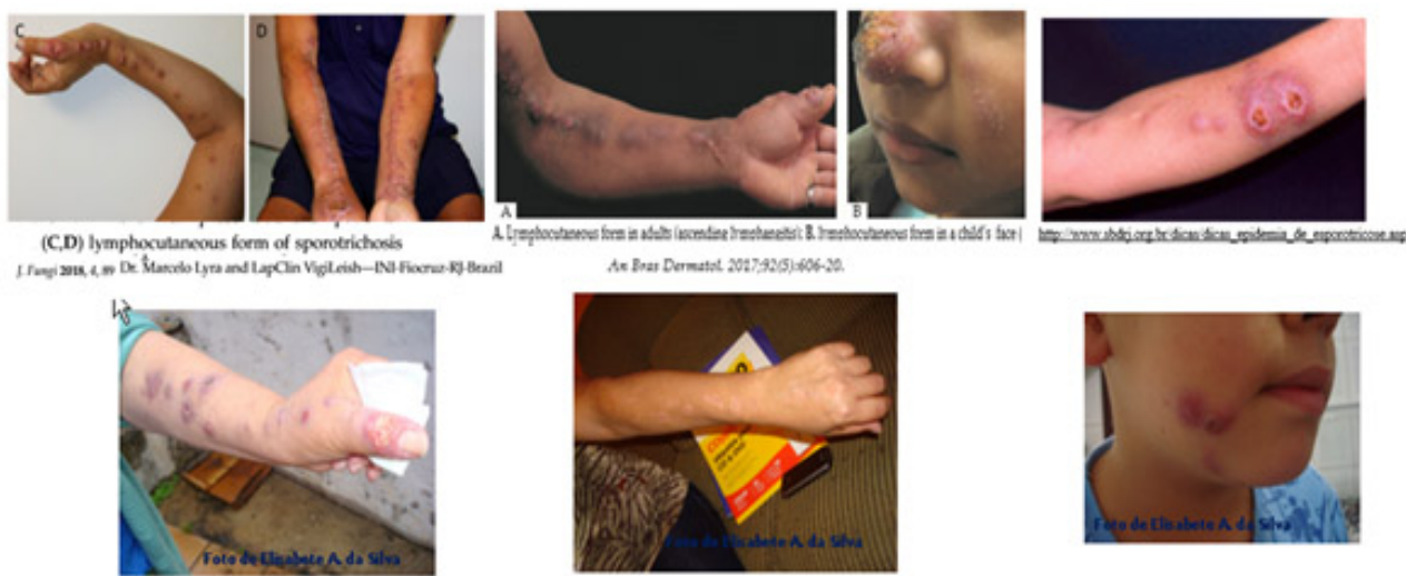
Figura 4 – Imagens de lesões cutâneo linfáticas

É a forma mais frequente, de fácil diagnóstico da manifestação da esporotricose. A lesão inicial se caracteriza por um nódulo ou lesão pápulonodular, úlcero-gomosa, eritematosa, ou placa vegetante, que evolui em tamanho podendo ulcerar com pouco exsudato. A partir dela, forma-se um cordão endurecido que segue pelo vaso linfático