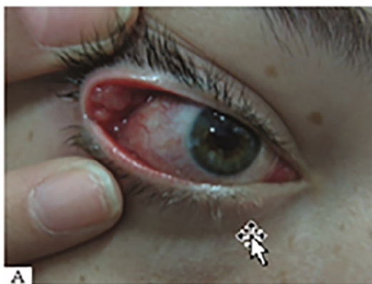
A. Granulomatous lesion at the upper eyelid ocular conjunctiva; An Bras Dermatol. 2017;92(5):606-20.