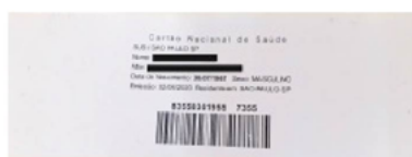
Figura 2: Impressão do cartão SUS a ser grampeada na ficha de encaminhamento.