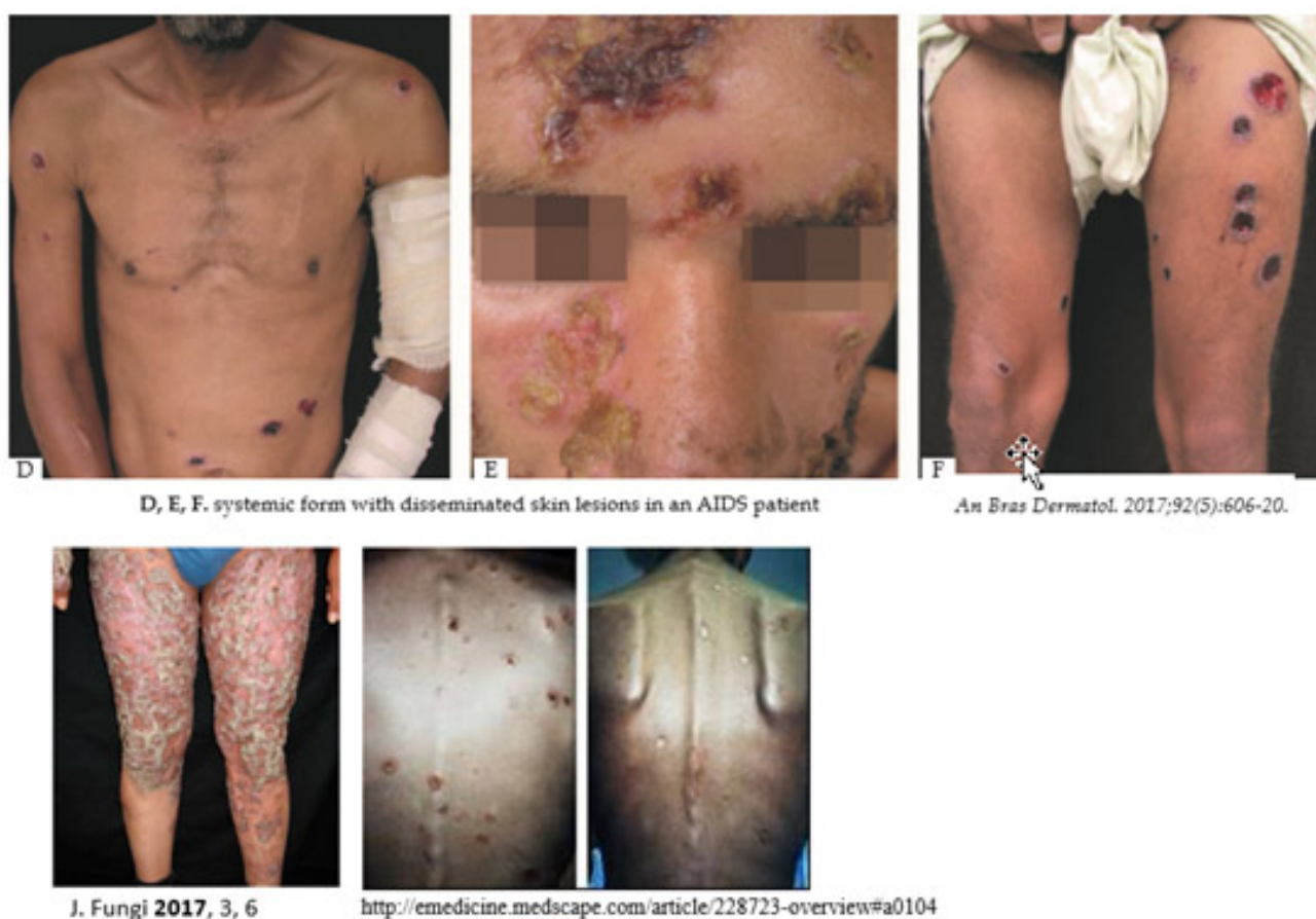
Figura 5 - Imagens de lesões cutâneas disseminadas

5.3 - FORMAS CUTÂNEO DISSIMINADA (Figura 5): As lesões nodulares, ulceradas ou verrucosas se disseminam pela pele. Esta forma é mais comum em pacientes imunodeprimidos, muitas vezes associada ao HIV, neoplasias, transplantados, em uso de corticóide, alcoolismo crônico, diabetes.