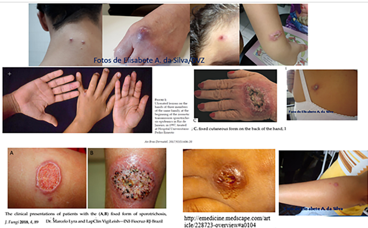
Figura 3 – Imagens de lesões cutâneas fixa ou localizada