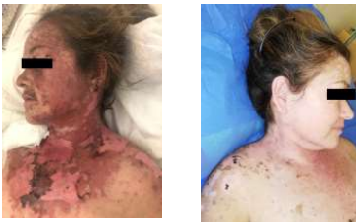
Figura 3: A. Mejoría de lesiones. B. Aspecto de la paciente al alta

La paciente es tratada con pulsos de metilprednisolona 1g/día por 3 días, luego prednisona oral 1mg/kg/día. Cobertura antibiótica con vancomicina por 14 días, hemodiálisis. Regresión de las lesiones (Figura 3). Alta a las 4 semanas (Figura 4).