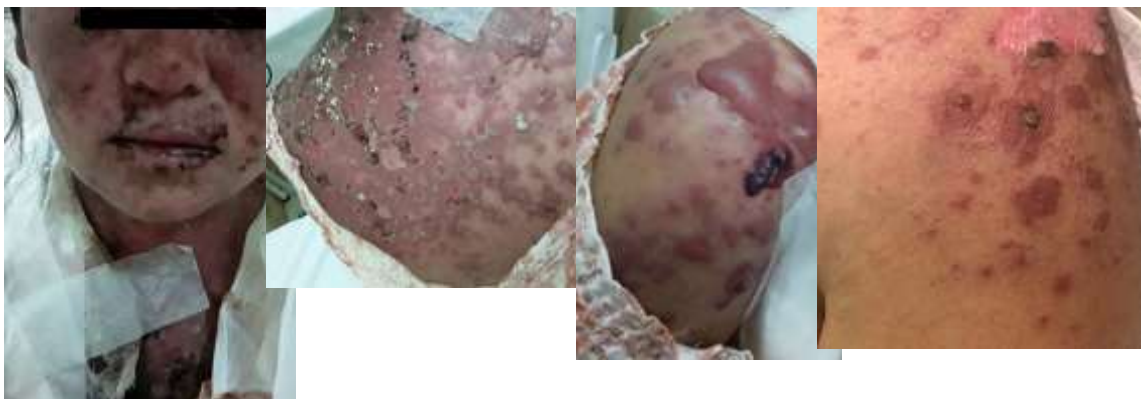
A B C D

El examen físico al ingreso reveló en piel, lesiones eritemato-purpúricas, ampollas, áreas denudadas, costras hemáticas, signo de Nikolsky negativo, localizadas en áreas fotos expuestas (rostro, cuello, escote, espalda), incluso en mucosa labial. (Figuras 1A,B,C).