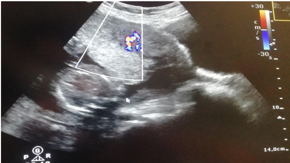
Fig.1: Ecografía obstétrica; nótese la falta de delimitación placentario/miometrial con invasión placentaria al miometrio.

Previo al acto quirúrgico se realizó colocación de Traje Anti shock no neumático (TANN) y control de signos vitales por Escala de alerta precoz obstétrica (EAPO) (4) .