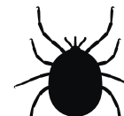
Amblyomma sculptum Carrapato - estrela