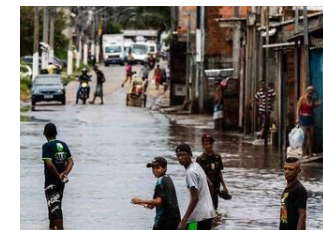
Imagem 1: https://spdiario.com.br/moradores-sofrem-com-infestacao-de-ratos-na-zona-sul-de-sp/ Imagem 2: https://www.prefeitura.sp.gov.br/cidade/secretarias/subprefeituras/jacana_tremembe/noticias/?p=90369