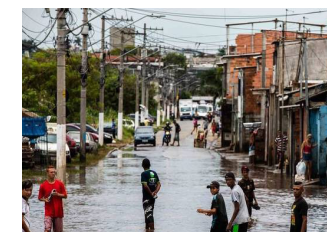
Imagem 1: https://spdidiario.com.br/moradores-sofrem-com-infestacao-de-ratos-na-zona-sul-de-sp/