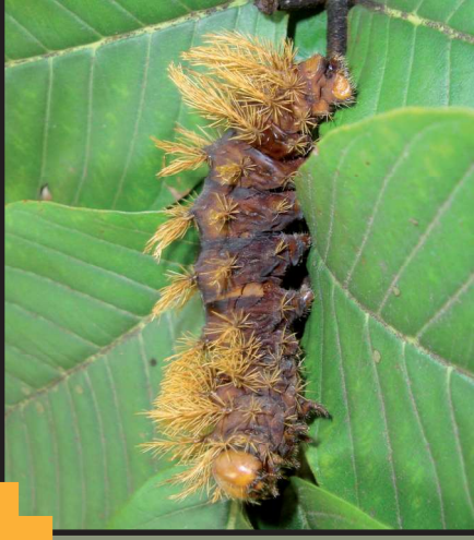
Taturana ( Automeris spp)

Os acidentes com lagartas são mais frequentes no verão e, geralmente, ocorrem durante atividades de trabalho e lazer ao ar livre. Folhas roídas e fezes espalhadas no solo, embaixo das plantas, denunciam a presença de lagartas.