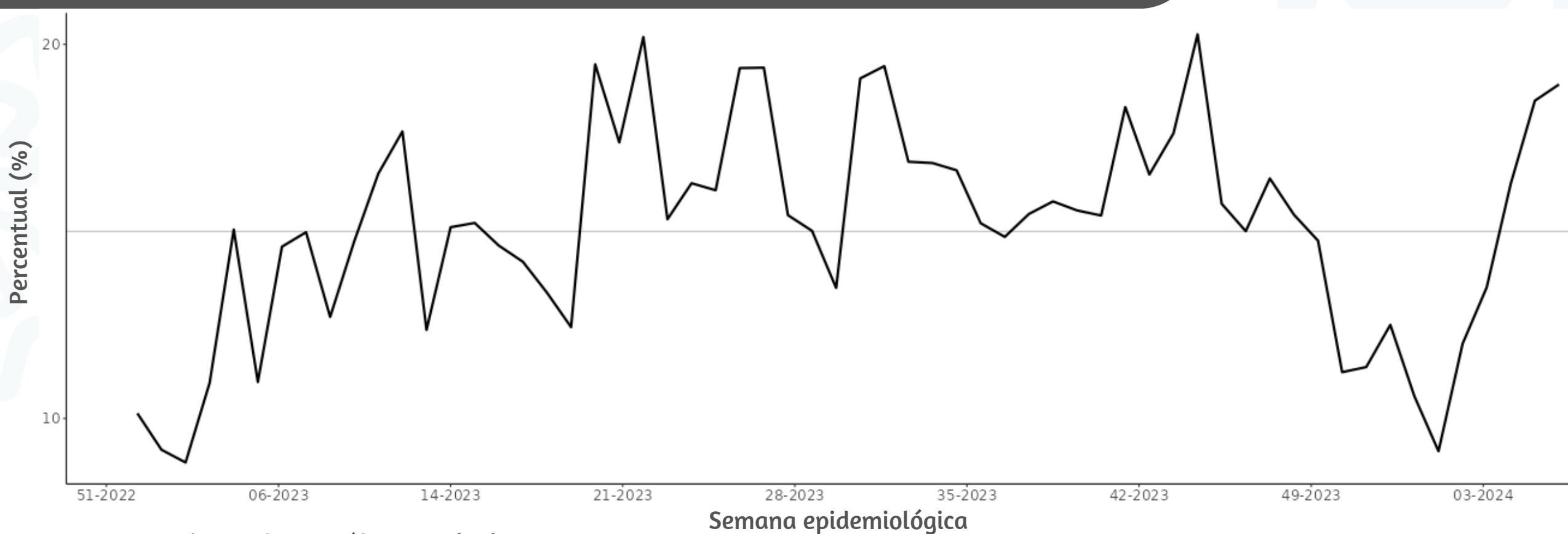
Figura 3. Percentual de atendimentos por Síndrome Gripal(%) em Unidade Sentinela segundo semana epidemiológica de início de sintomas, MSP, 2023 a 2024

Fonte: SIVEP Gripe. Dados extraídos em 27/02/2024.