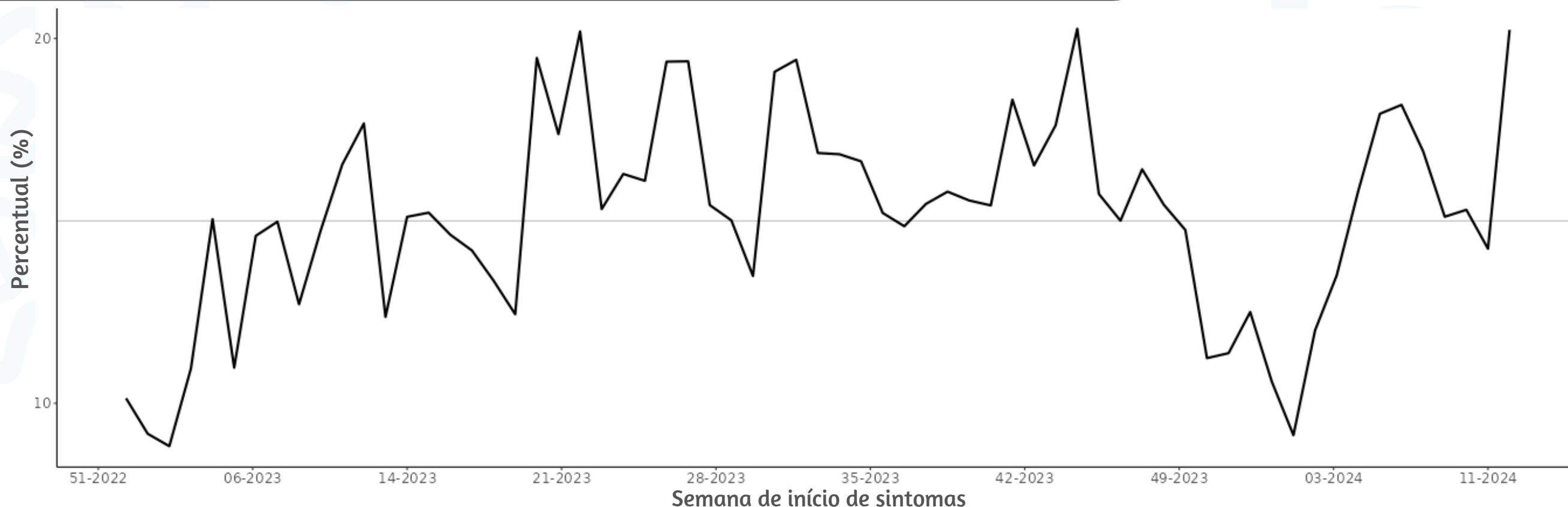
Figura 3. Percentual de atendimentos por Síndrome Gripal(%) em Unidade Sentinela segundo semana epidemiológica de início de sintomas, MSP, 2023 a 2024

Fonte: SIVEP Gripe. Dados extraídos em 02/04/2024.