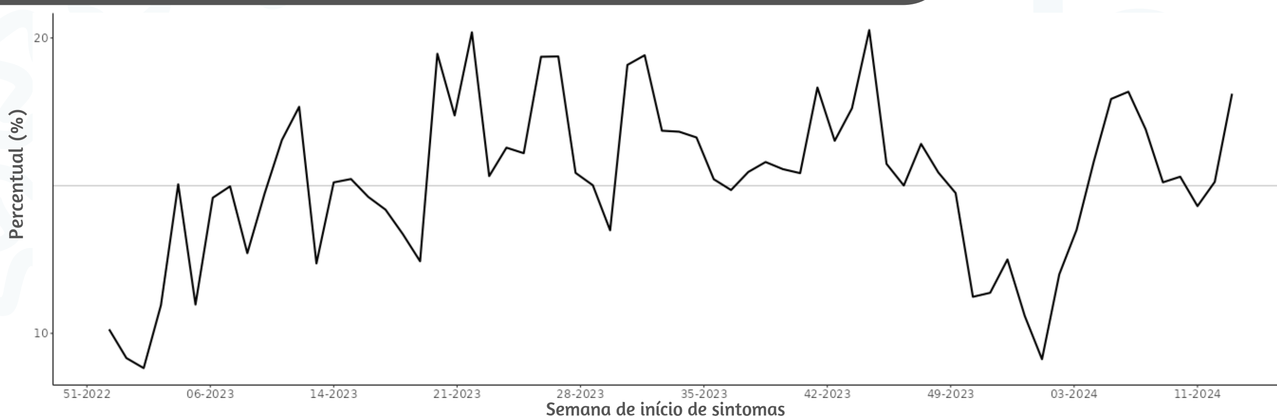
Figura 3. Percentual de atendimentos por Síndrome Gripal(%) em Unidade Sentinela segundo semana epidemiológica de início de sintomas, MSP, 2023 a 2024

Fonte: SIVEP Gripe. Dados extraídos em 09/04/2024.