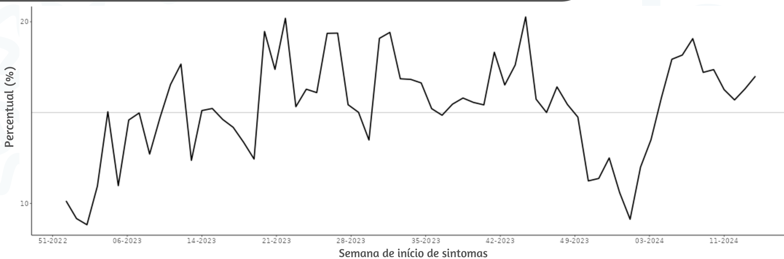
Figura 3. Percentual de atendimentos por Síndrome Gripal(%) em Unidade Sentinela segundo semana epidemiológica de início de sintomas, MSP, 2023 a 2024

Fonte: SIVEP Gripe. Dados extraídos em 16/04/2024.