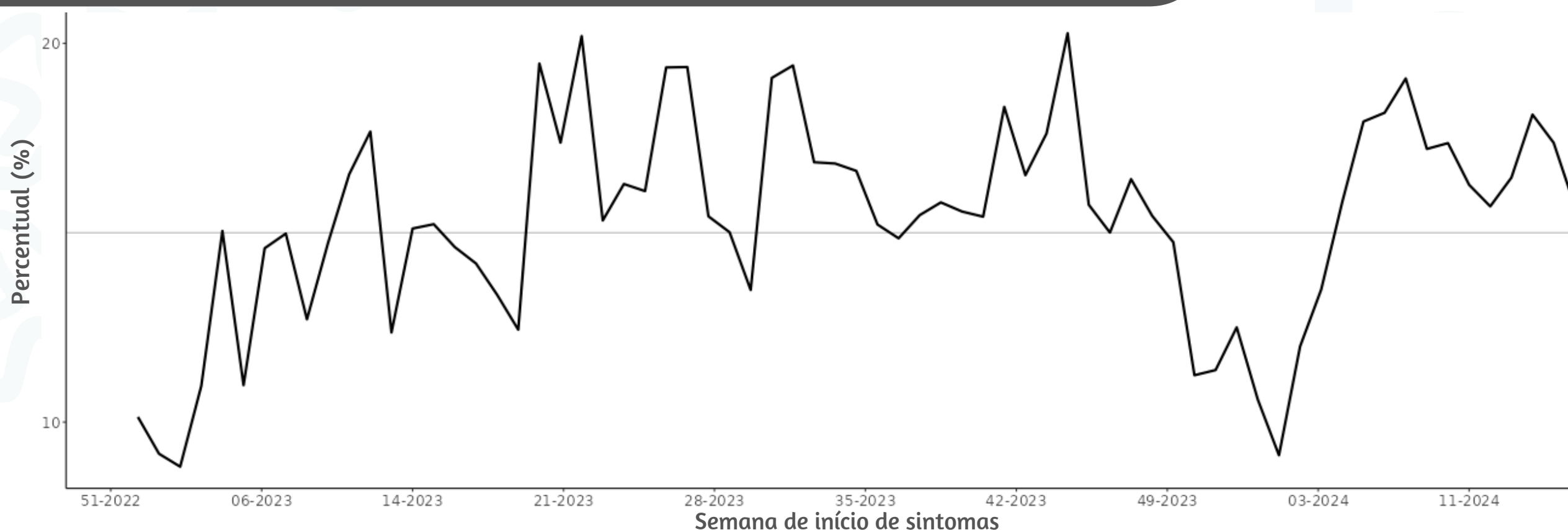
Figura 3. Percentual de atendimentos por Síndrome Gripal(%) em Unidade Sentinela segundo semana epidemiológica de início de sintomas, MSP, 2023 a 2024

Fonte: SIVEP Gripe. Dados extraídos em 30/04/2024.