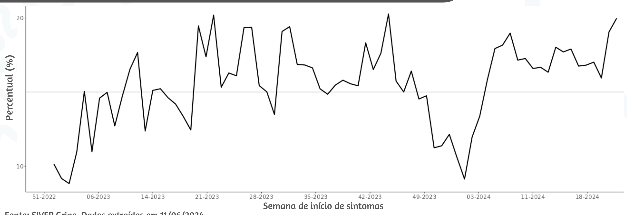
Figura 3. Percentual de atendimentos por Síndrome Gripal(%) em Unidade Sentinela segundo semana epidemiológica de início de sintomas, MSP, 2023 a 2024

Fonte: SIVEP Gripe. Dados extraídos em 11/06/2024.