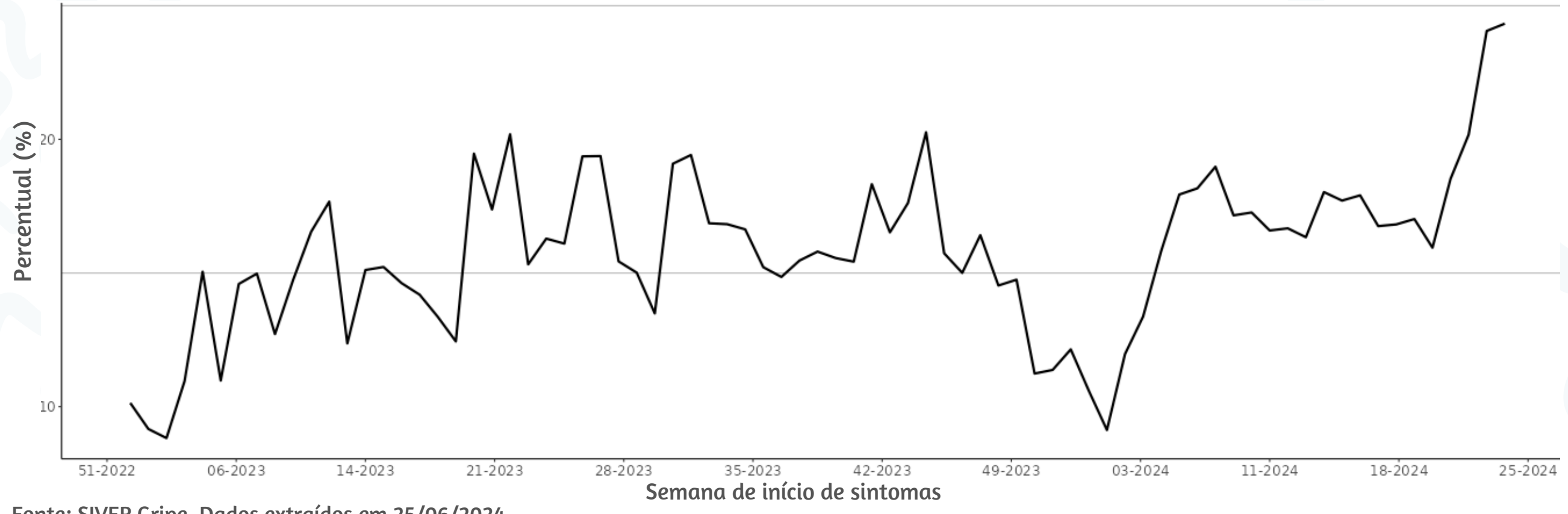
Figura 3. Percentual de atendimentos por Síndrome Gripal(%) em Unidade Sentinela segundo semana epidemiológica de início de sintomas, MSP, 2023 a 2024

Fonte: SIVEP Gripe. Dados extraídos em 25/06/2024.