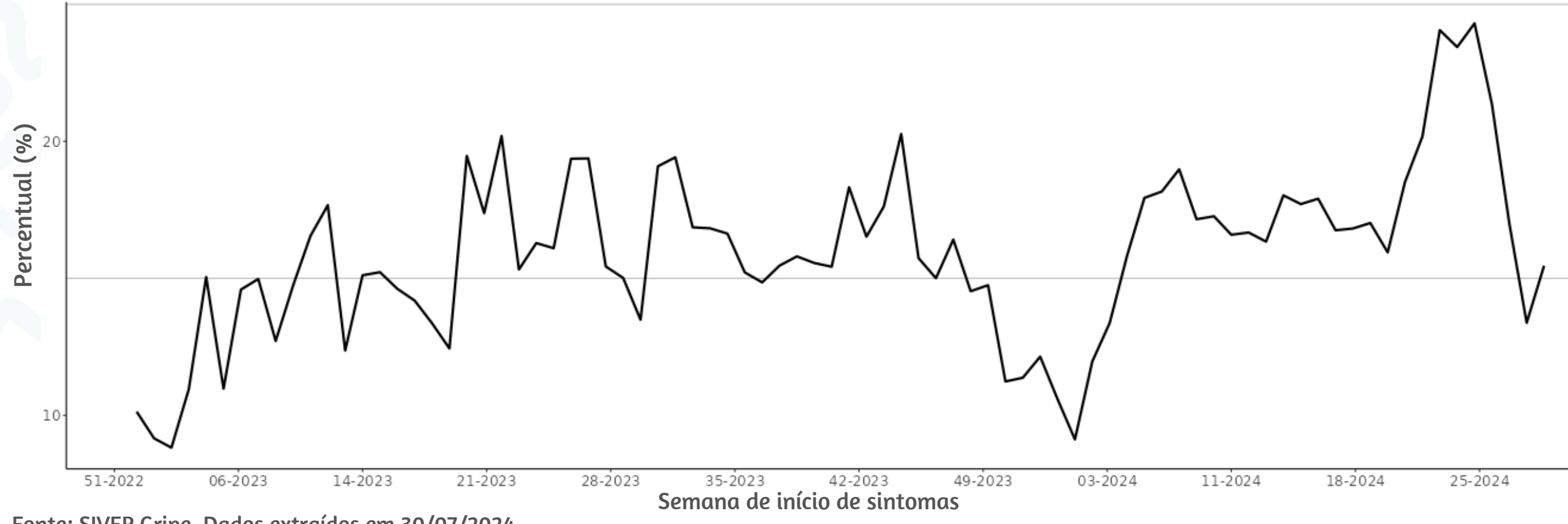
Figura 3. Percentual de atendimentos por Síndrome Gripal(%) em Unidade Sentinela segundo semana epidemiológica de início de sintomas, MSP, 2023 a 2024

Fonte: SIVEP Gripe. Dados extraídos em 30/07/2024.