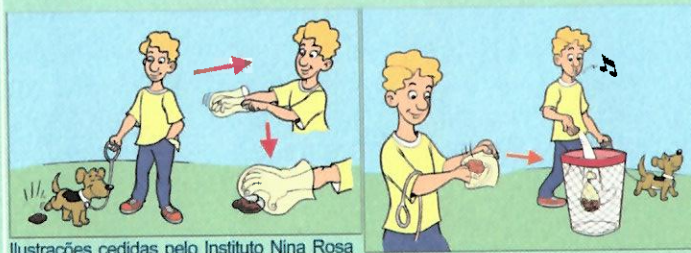
Ilustrações cedidas pelo Instituto Nina Rosa